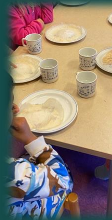
Smaksprøvar på Indisk mat