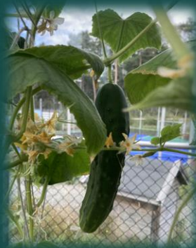
Agurk frå eige veksthus

«Gjennom arbeid med kropp, rørsele mat og helse skal barnehagen bidra til at barna får innsikt i kvar maten kjem frå, matproduksjon og vegen frå mat til måltid». (Rammeplanen for barnehagen side 50.)