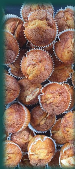
Epledagen- med eplemuffins